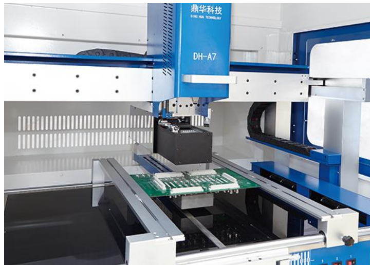
上下温区自由移动